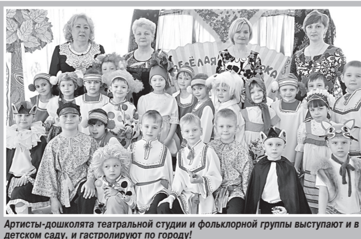
Артисты-дошколята театральной студии и фольклорной группы выступают в детском саду, и гастролируют по городу!