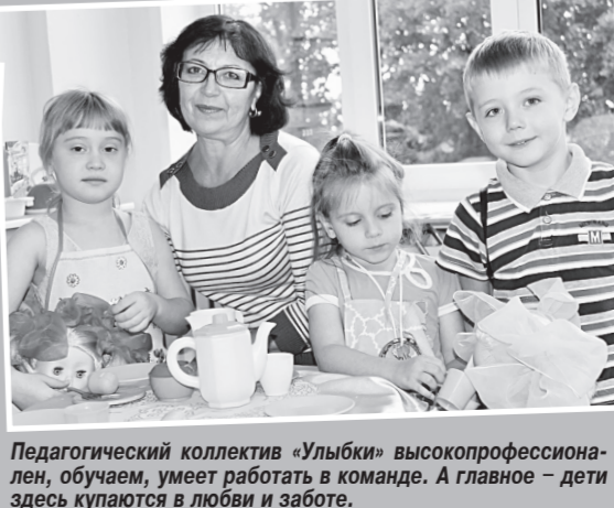
Педагогический коллектив «Улыбки» высокопрофессионален, обучаем, умеет работать в команде. А главное – дети здесь купаются в любви и заботе.