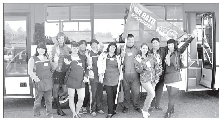
Кто под флагом дружно в ряд? Наш кондукторский отряд!